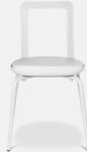
W-2020 stool outdoor