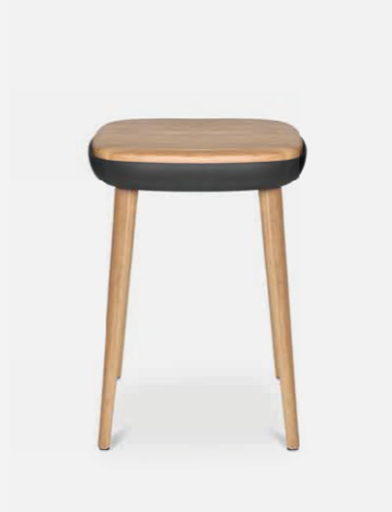
W-2020 stool S