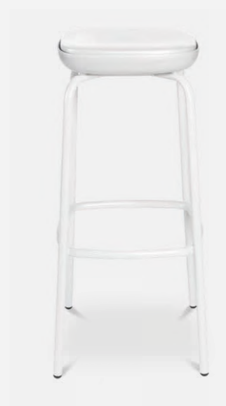
W-2020 stool outdoor