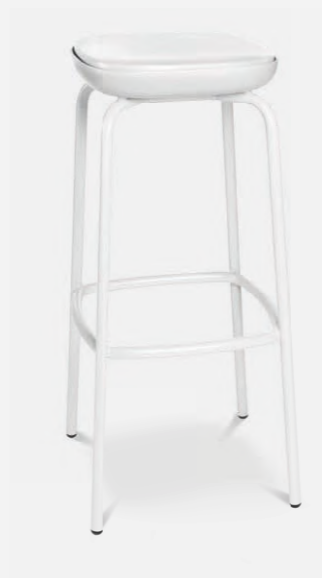
W-2020 stool outdoor

W-2020 stool outdoor Sitzschale, Sitzfläche und das Gestell sind in drei unterschiedlichen Farbgestaltungen erhältlich - Charcoal Black, Muddy Taupe und Smokey White.