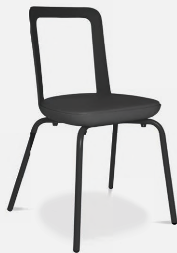
W-2020 stool outdoor