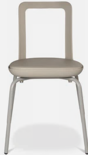
W-2020 stool outdoor