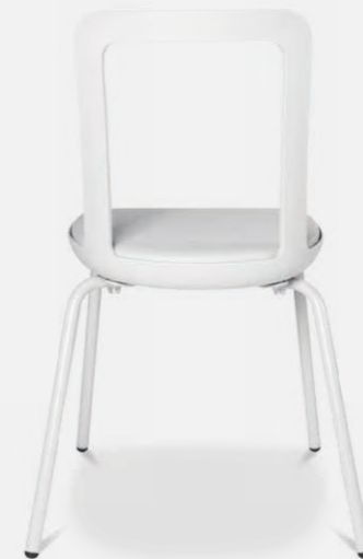
W-2020 stool outdoor

W-2020 chair outdoor Durch das pulverbeschichtete Stahlrohruntergestell ist der W-2020 outdoor absolut robust und witterungsbeständig. Außerdem lässt sich die Outdoorversion auch platzsparend mit bis zu 6 Stück übereinander stapeln.