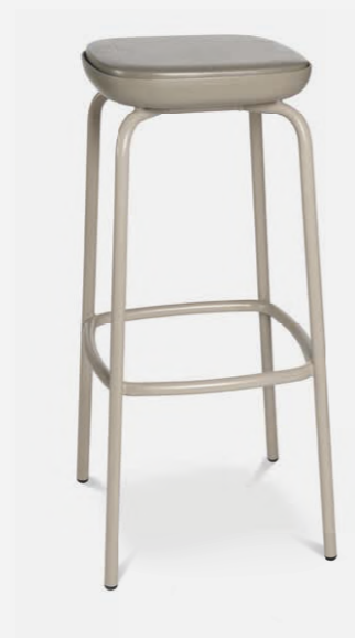
W-2020 stool outdoor