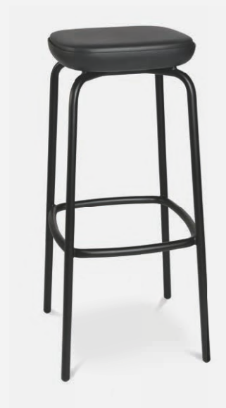
W-2020 stool outdoor