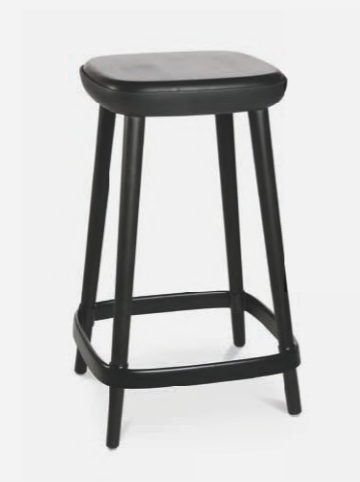
W-2020 stool M