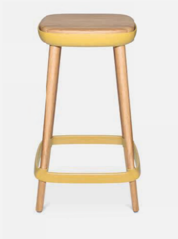
W-2020 stool M