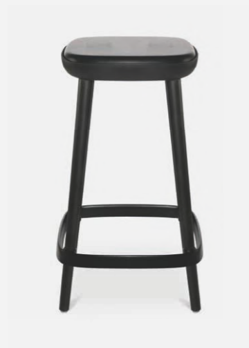
W-2020 stool M