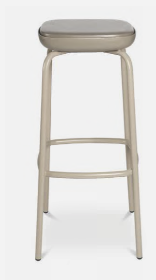
W-2020 stool outdoor