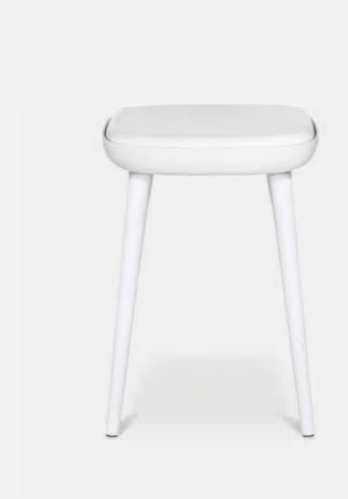
W-2020 stool S