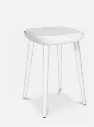
W-2020 stool S

W-2020 stool Insgesamt stehen Ihnen drei unterschiedliche Sitzhöhen bei der Konfiguration des W-2020 stool zur Verfügung. Die Varianten unterscheiden sich durch verschiedene Sitzhöhen. Erhältlich als Standard Barthekehöhe (Sitzhöhe: 83 cm), „M“ Version (Sitzhöhe: ca. 65 cm) z. B. für den Küchenblock oder lieber den Hocker „S“ Version mit einer normalen Sitzhöhe von 47 cm.