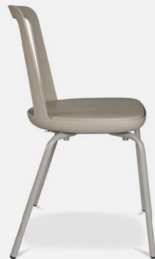
W-2020 stool outdoor