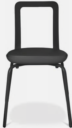
W-2020 stool outdoor