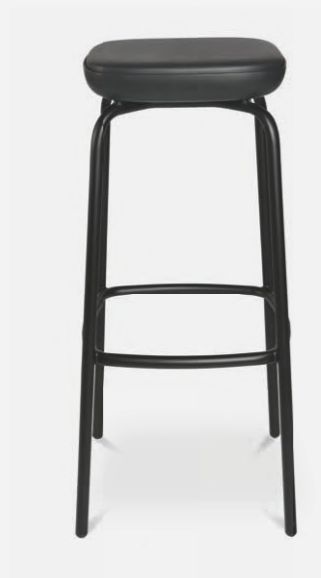
W-2020 stool outdoor