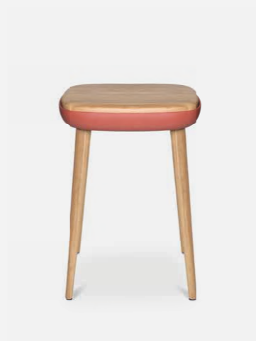
W-2020 stool S

W-2020 stool Sitzschale und Fußring sind in insgesamt 5 trendigen Kunststofffarben erhältlich - Smokey White, Charcoal Black, Muddy Taupe, Chestnut Red und Mustard Yellow. Zusätzliche Echtholz-Komponenten sowie unzählige Polsterfarben lassen keine Wünsche bei Ihrem Einrichtungsdesign offen.