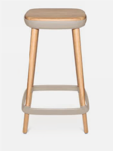
W-2020 stool M